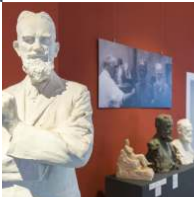
MUSEO DEL PAESAGGIO