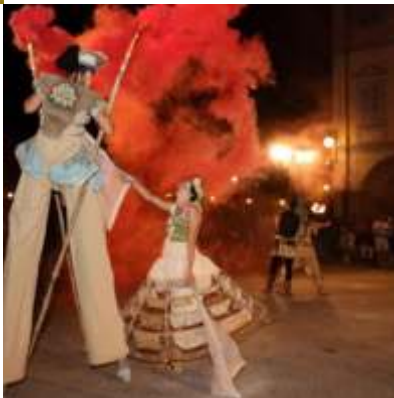
CROSS FESTIVAL DI ARTI MODERNE