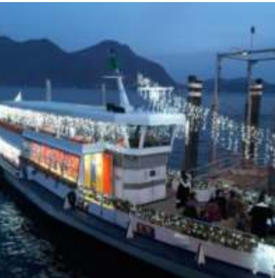
BATTELLO DI BABBO NATALE