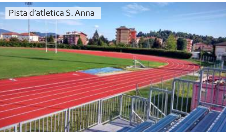
Pista d'atletica S. Anna