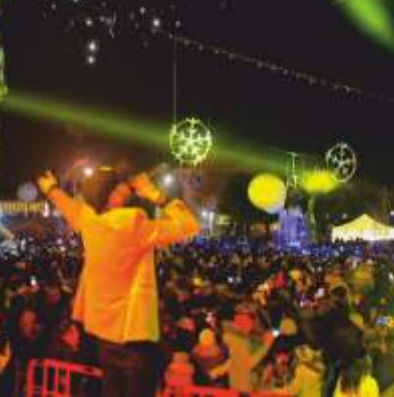
CAPODANNO IN PIAZZA